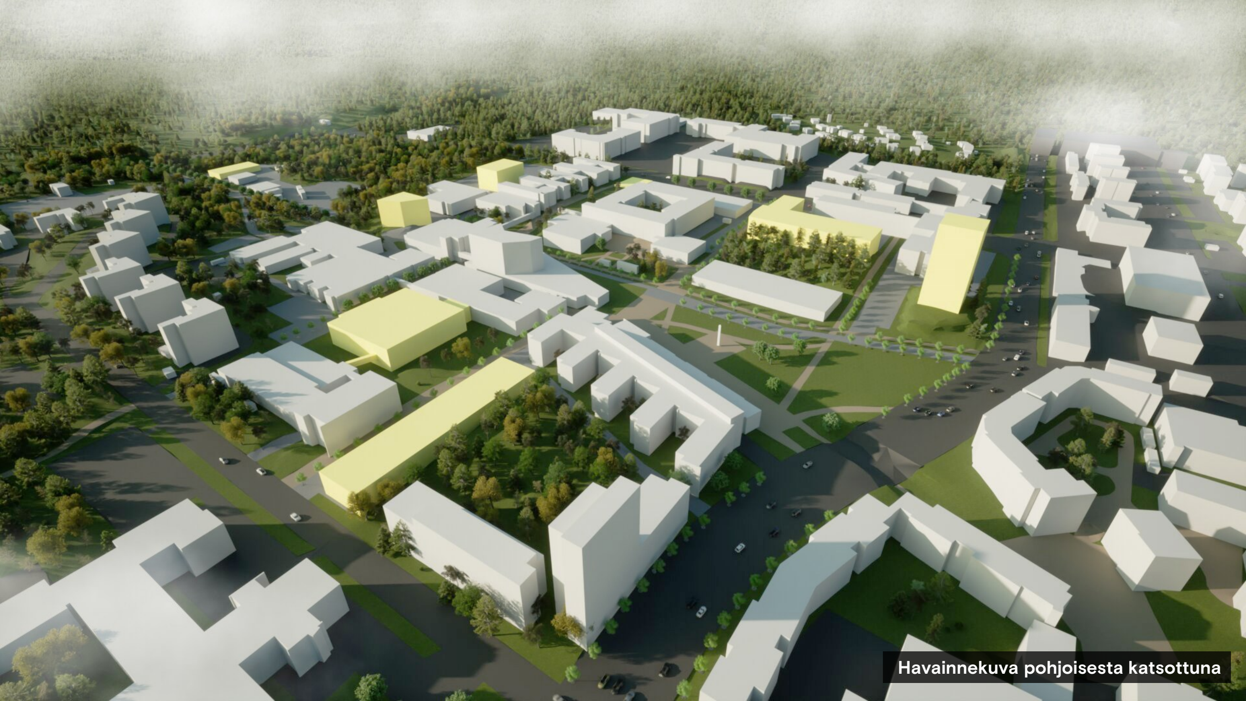
Havainnekuva pohjoisesta katsottuna