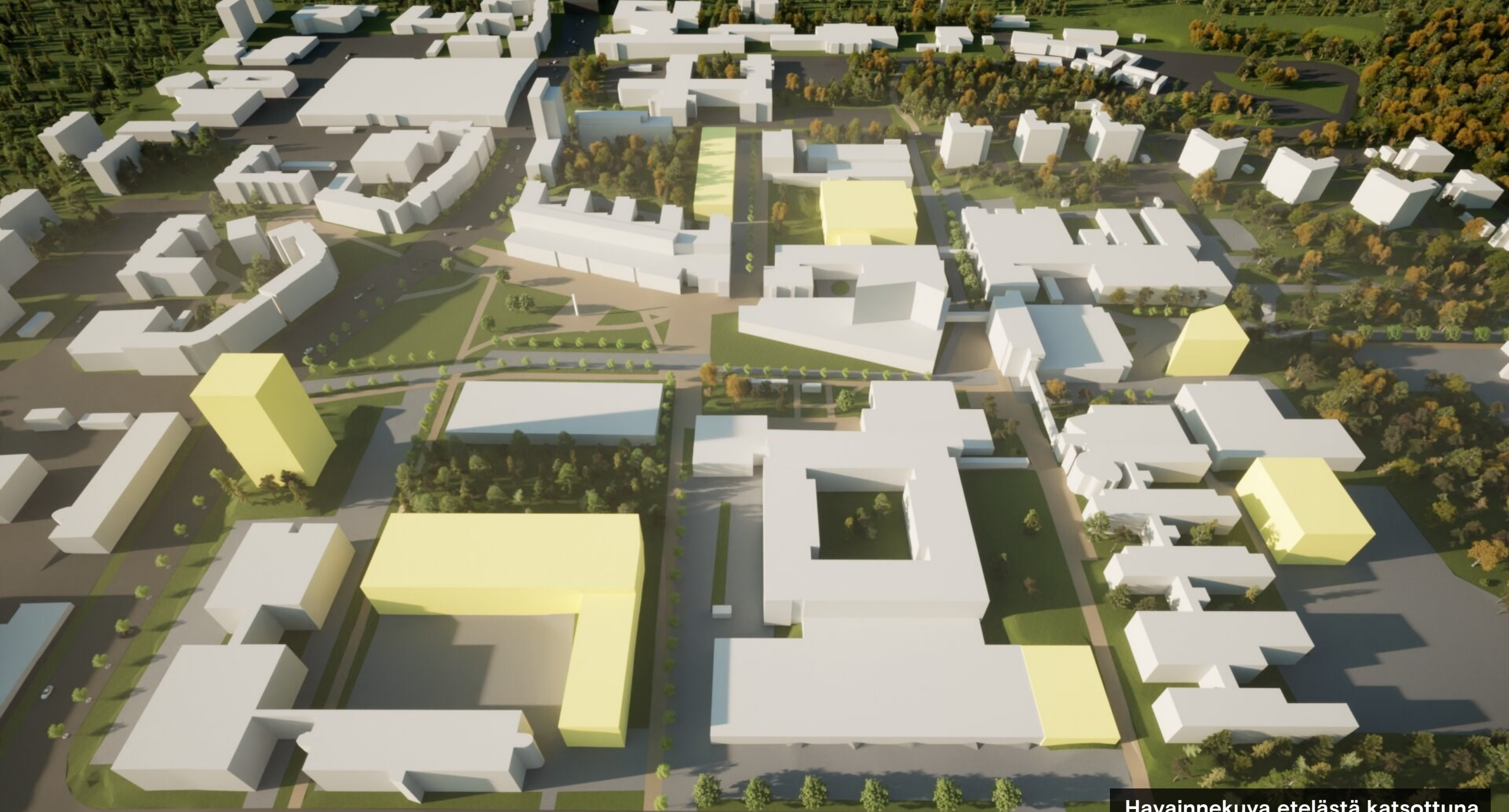
Havainnekuva etelästä katsottuna